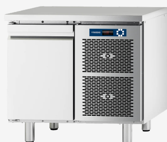
Table réfrigérée MI 1 porte -2/+8°C sans dossier