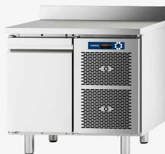
Table réfrigérée MI 1 porte -2/+8°C avec dossier