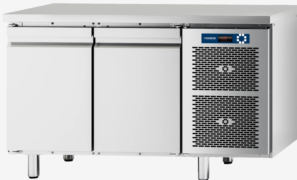
Table réfrigérée MI 2 portes -2+8°C sans dossier