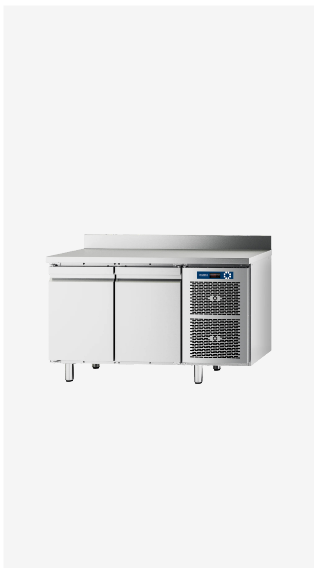
Table réfrigérée MI 2 portes -2/+8°C avec dossieret