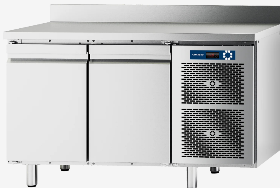
Table réfrigérée MI 2 portes -2+8°C avec dossieret