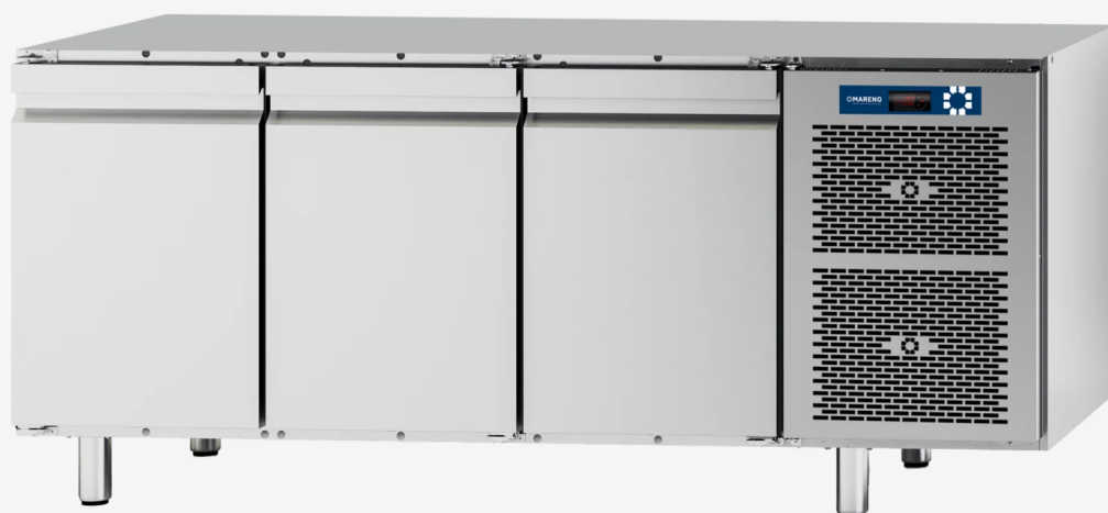
Table réfrigérée MI 3 portes -2+8°C sans dessus