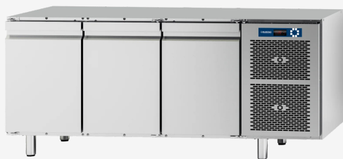
Table réfrigérée MI 3 portes -2+8°C sans dessus