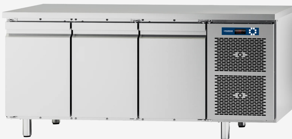
Table réfrigérée MI 3 portes -2+8°C sans dossier