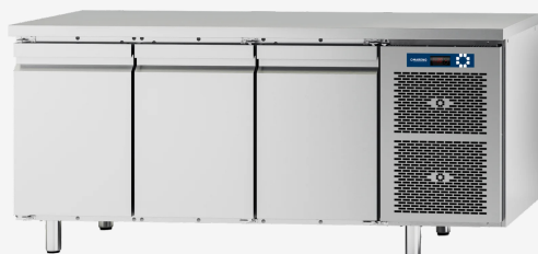
Table réfrigérée MI 3 portes -2+8°C sans dossier