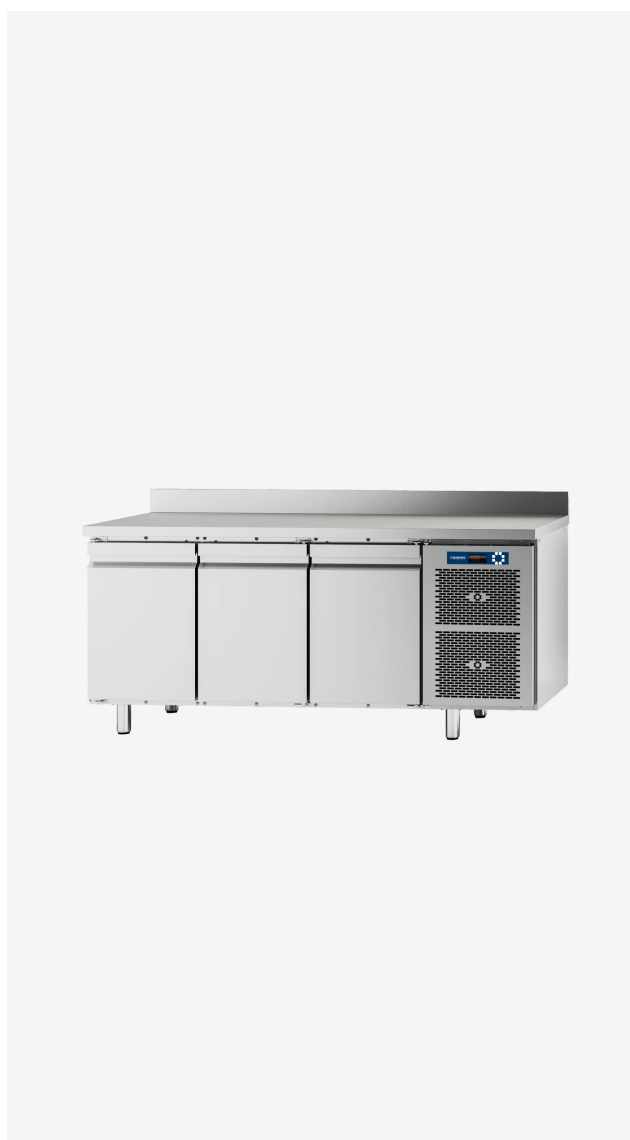
Table réfrigérée MI 3 portes -2/+8°C avec dossieret