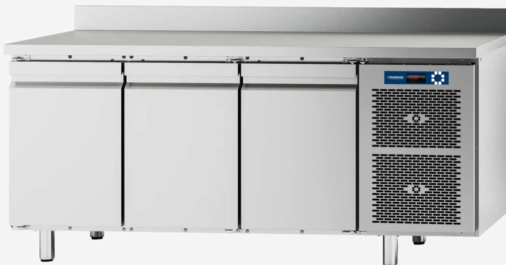
Table réfrigérée MI 3 portes -2+8°C avec dossieret