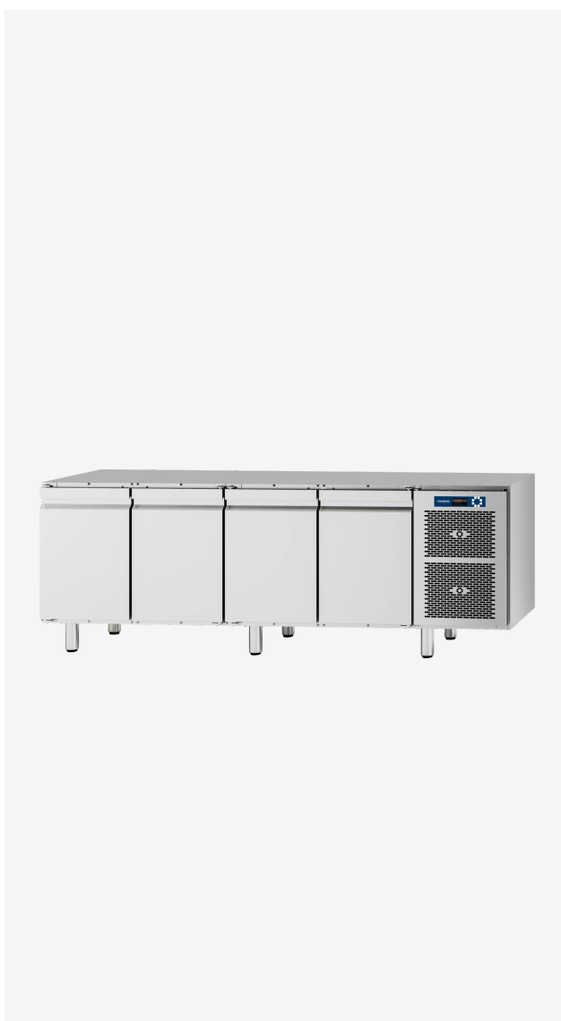
Table réfrigérée MI 4 portes -2+8°C sans dessus