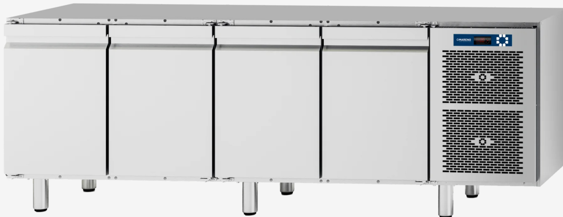
Table réfrigérée MI 4 portes -2+8°C sans dessus