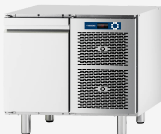
Table réfrigérée MI I porte -10 - 20°C sans dessus