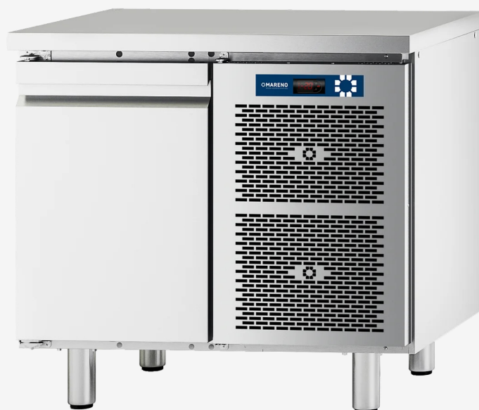
Table réfrigérée MI 1 porte -10 - 20°C sans dossier