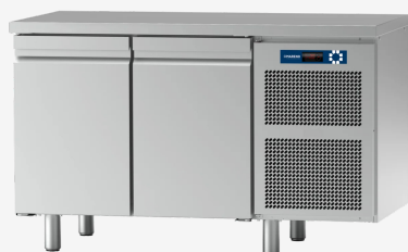
Table réfrigérée MO 2 portes O + 10°C sans dossier