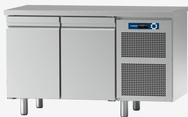
Table réfrigérée MO 2 portes -10 - 20°C sans dossier