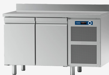
Table réfrigérée MO 2 portes -10 - 20°C avec dossier