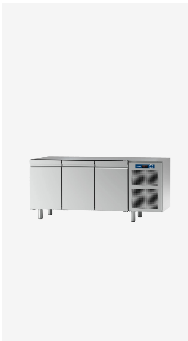
Table réfrigérée MO 3 portes O + 10°C sans dessus