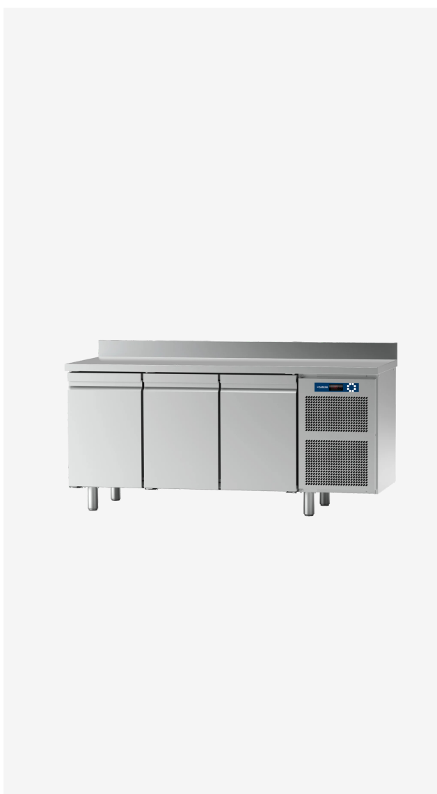
Table réfrigérée MO 3 portes O + 10°C avec dossier