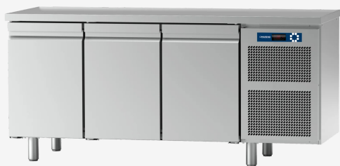
Table réfrigérée MO 3 portes -10 - 20°C sans dossier