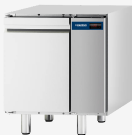
Table réfrigérée MI I porte -2/+8°C groupe à distance sans dessus