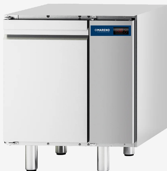
Table réfrigérée MI 1 porte -2+8°C groupe à distance sans dessus