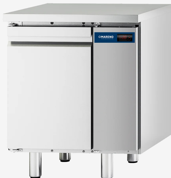
Table réfrigérée MI 1 porte -2+8°C groupe à distance sans dossier