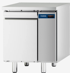
Table réfrigérée MI 1 porte -2/+8°C groupe à distance sans dossier