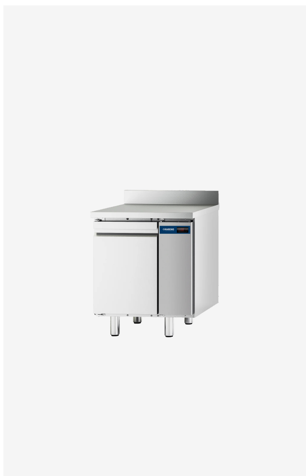
Table réfrigérée MI I porte -2/+8°C groupe à distance avec dossier