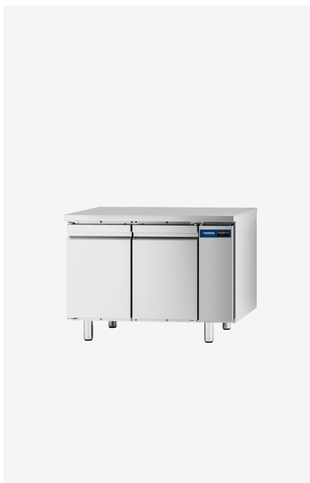
Table réfrigérée MI 2 portes -2/+8°C groupe à distance sans dossier