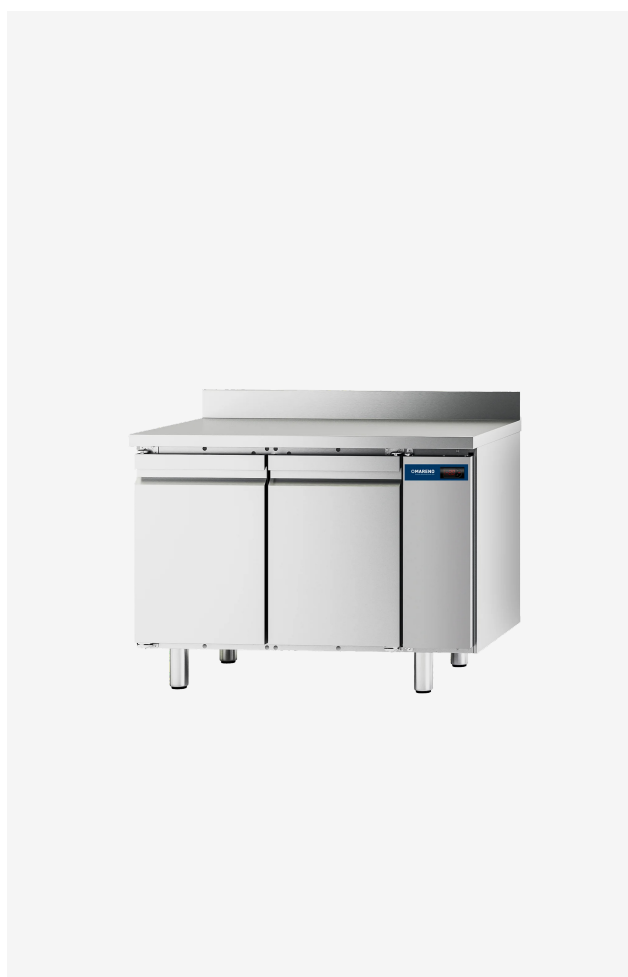
Table réfrigérée MI 2 portes -2/+8°C groupe à distance avec dossier