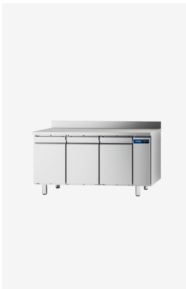
Table réfrigérée MI 3 portes -2/+8°C groupe à distance avec dossier