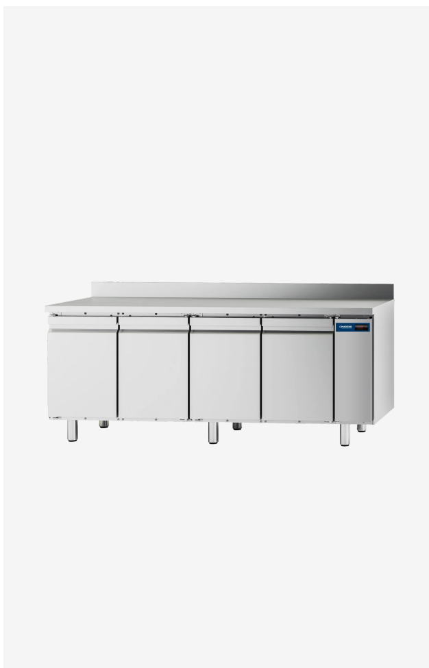
Table réfrigérée MI 4 portes -2/+8°C groupe à distance avec dossier