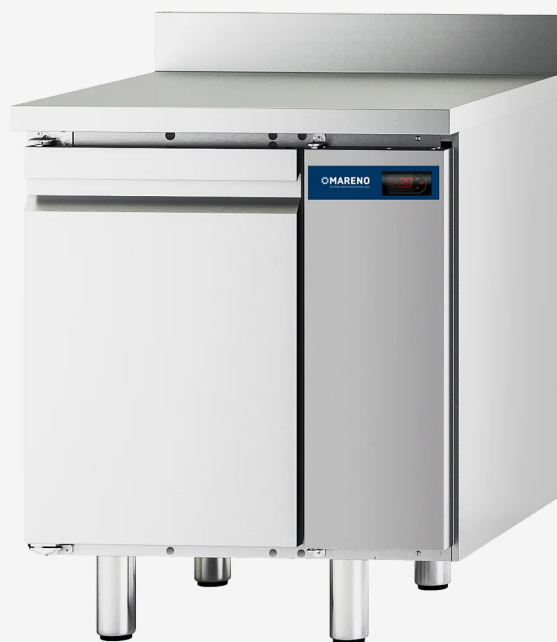
Table réfrigérée MI 1 porte -10 -20°C groupe à distance avec dossier