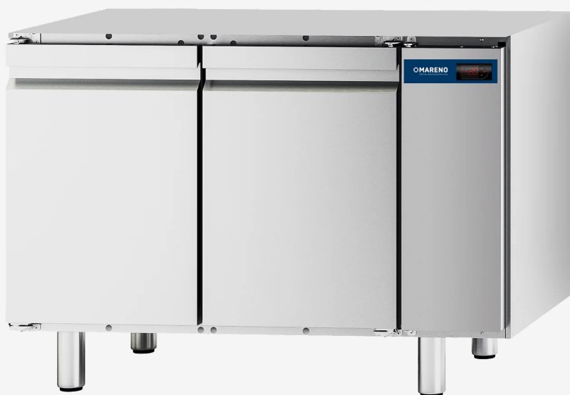
Table réfrigérée M1 2 portes -10 -20°C groupe à distance sans dessus