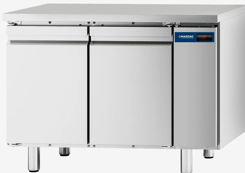
Table réfrigérée M1 2 portes -10 -20°C groupe à distance sans dossier