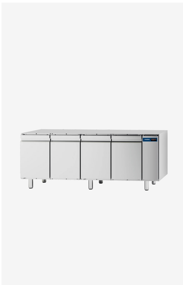
Table réfrigérée MI 4 portes -10 -20°C groupe à distance sans dessus